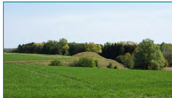
Signes høj/Signe's Hillock/Signes Hügel Set fra/seen from/vom Skælskørvej